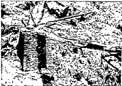
नाले की टूटी पुलिया